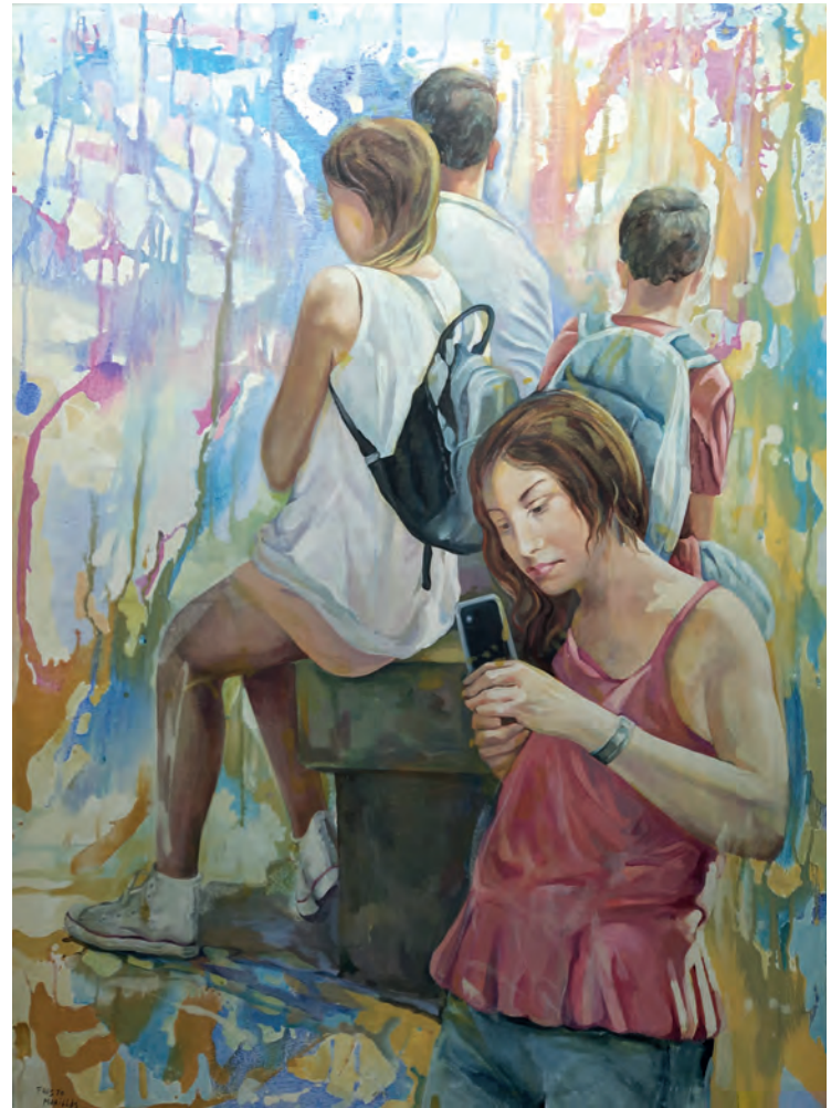
Serie: "La realidad paralela" / Acrílico sobre lienzo. 130x97