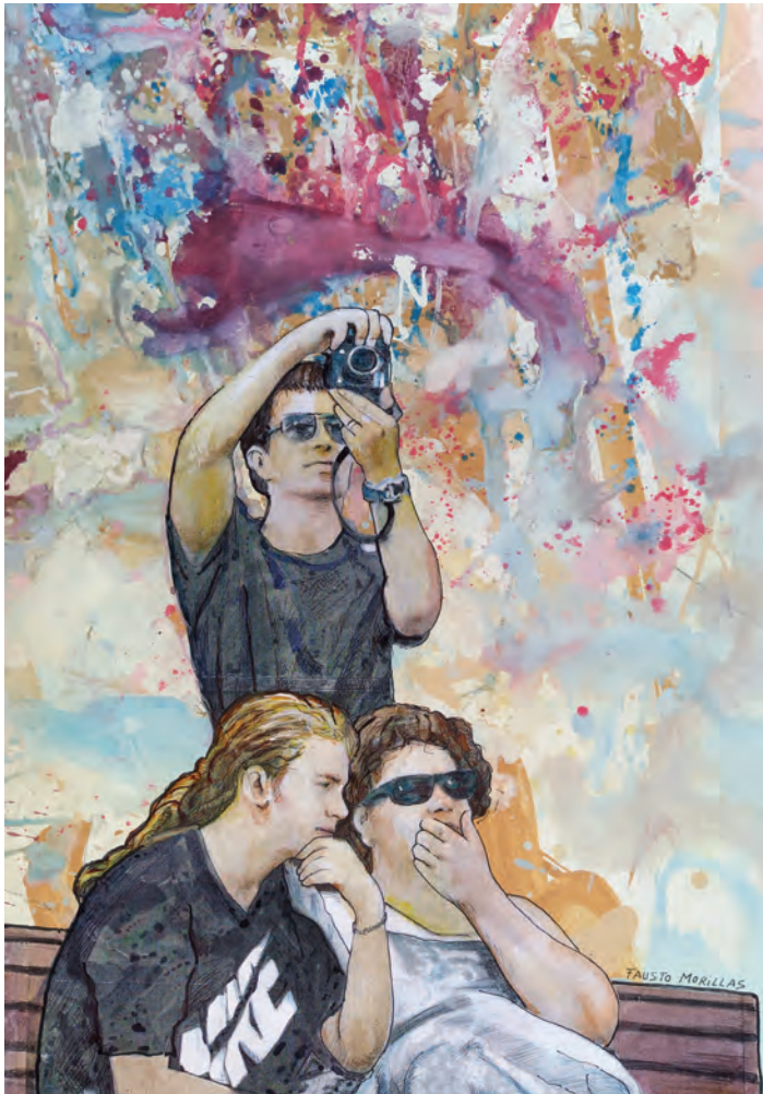
Serie: "La realidad paralela" / Técnica mixta sobre papel. 70x50