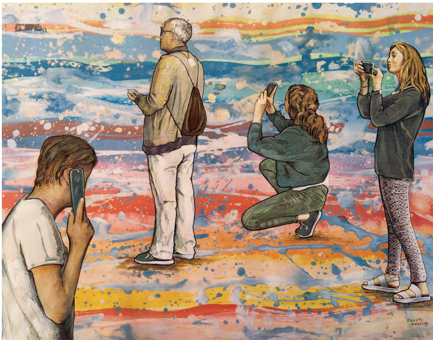
Serie: "La realidad paralela" / Técnica mixta sobre papel. 100x70