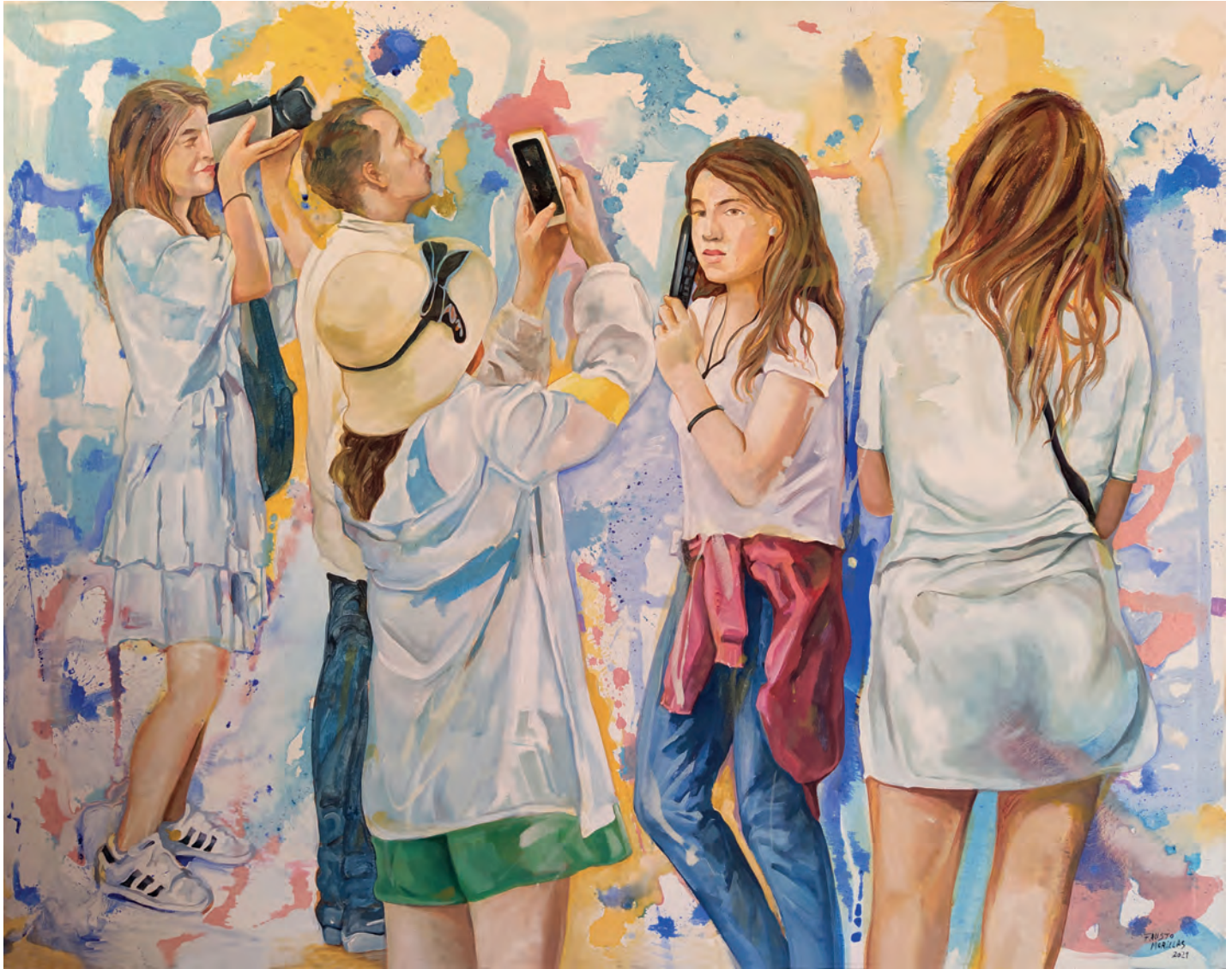
Serie: "La realidad paralela" / Acrílico sobre lienzo. 146x114