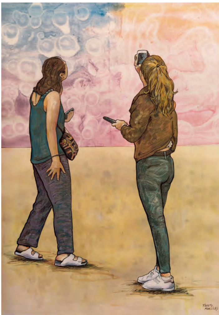
Serie: "La realidad paralela" / Técnica mixta sobre papel. 100x70