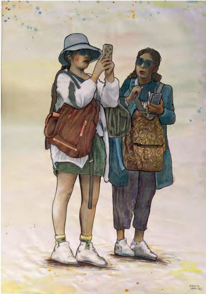
Mirar, ver, sentir...1 / Técnica mixta sobre papel 100x70.