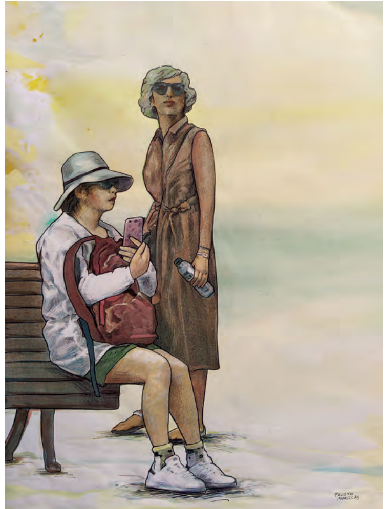
Mirar, ver, sentir...2 / Técnica mixta sobre papel 100x70