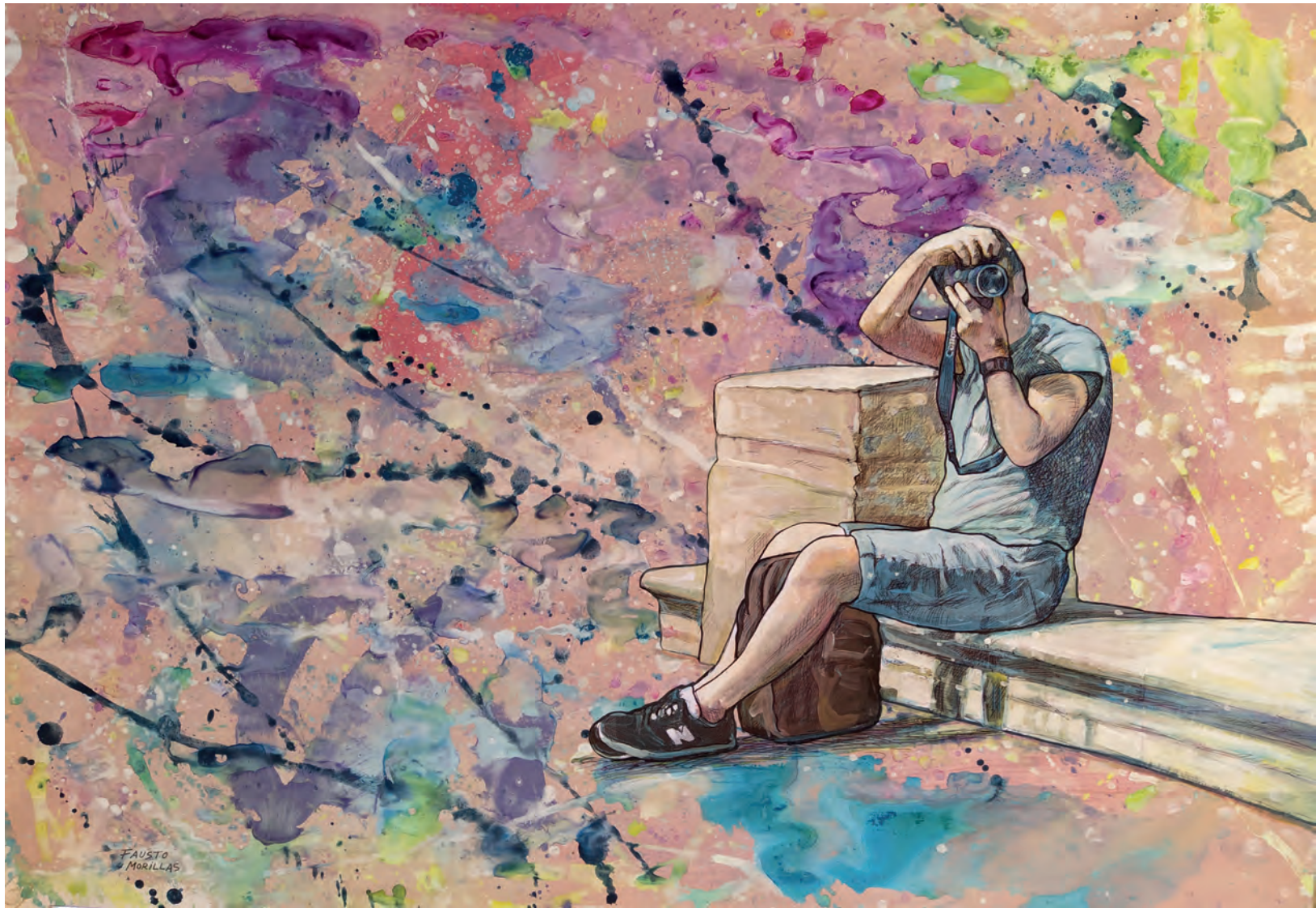
Imaginando la realidad. / Técnica mixta sobre papel 100x70