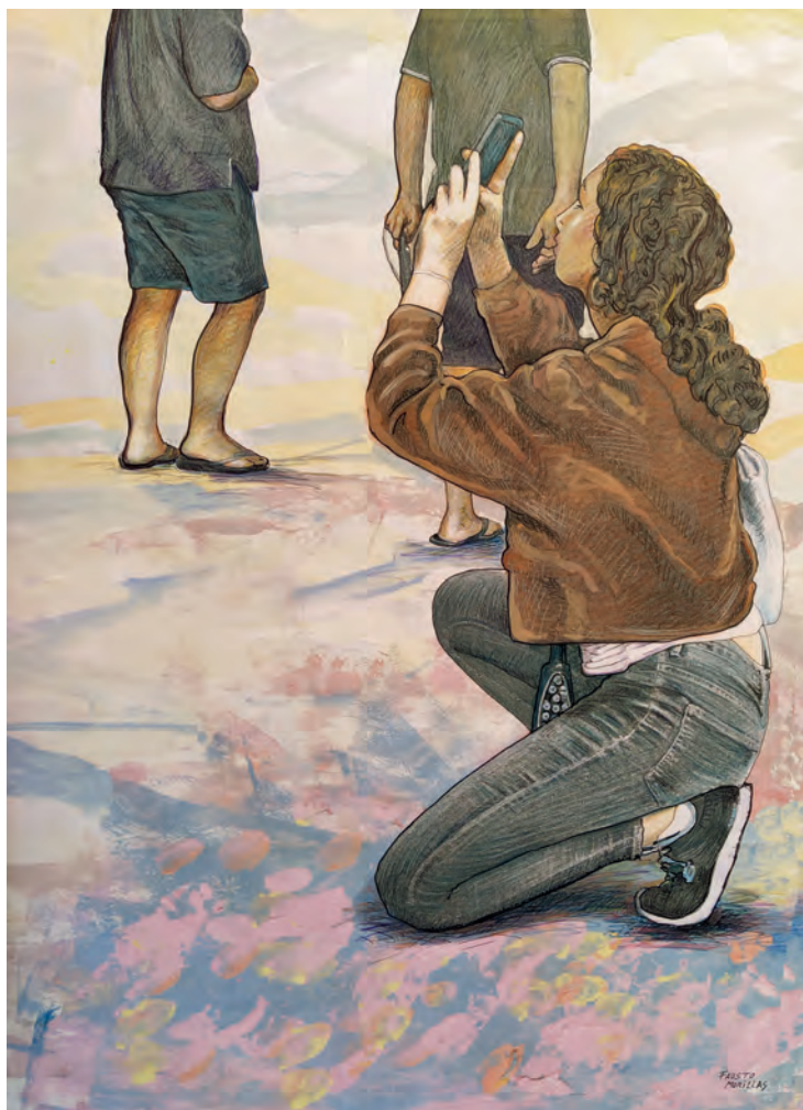
Serie: "La realidad paralela" / Técnica mixta sobre papel. 100x70