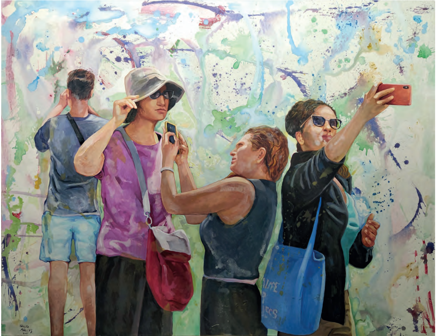
Serie: "La realidad paralela" / Acrílico sobre lienzo. 146x114