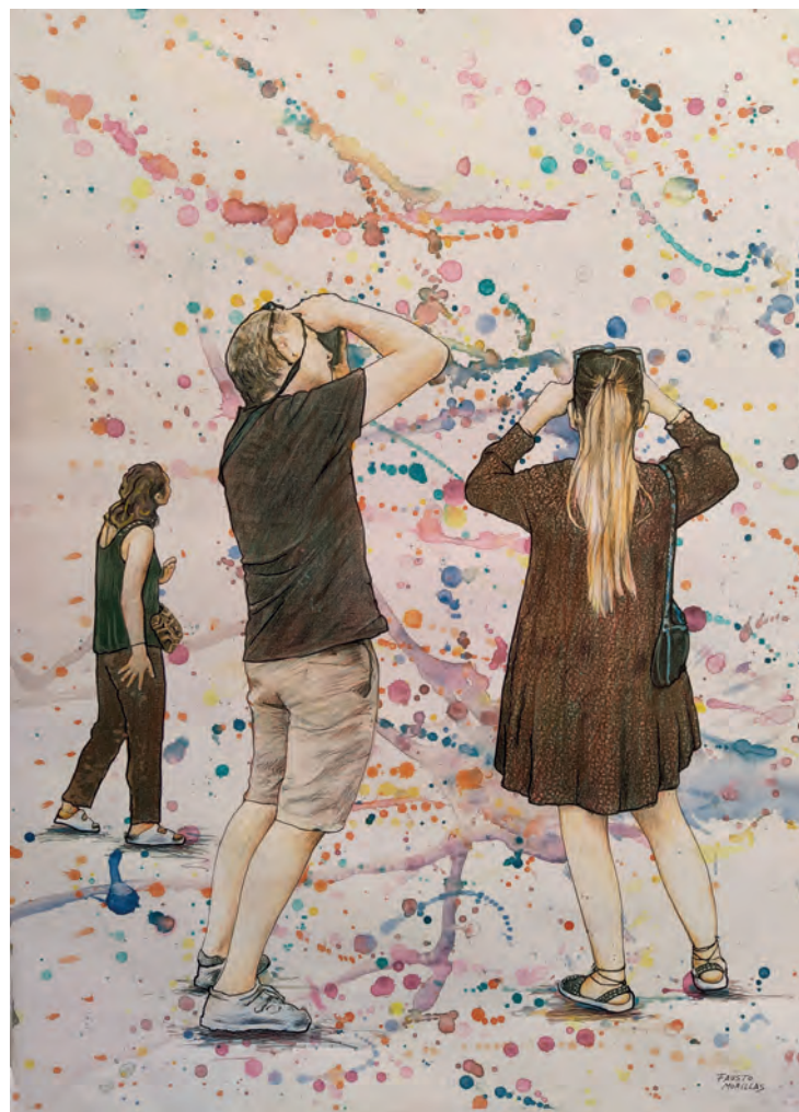
Serie: "La realidad paralela" / Técnica mixta sobre papel. 100x70