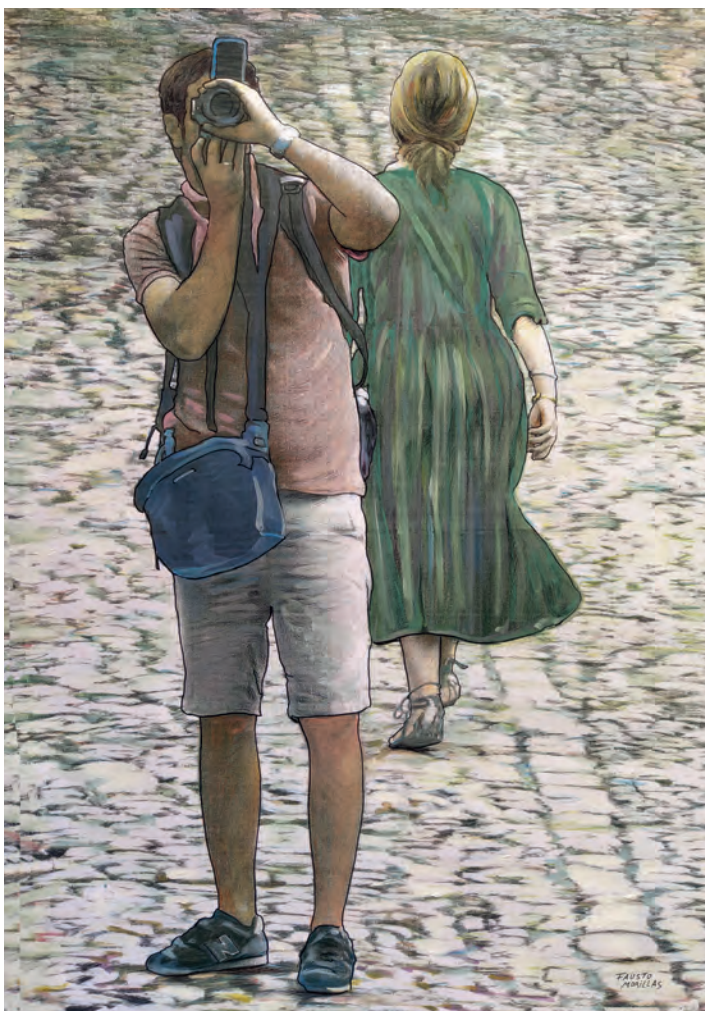
Serie: "La realidad paralela" / Técnica mixta sobre papel. 100x70