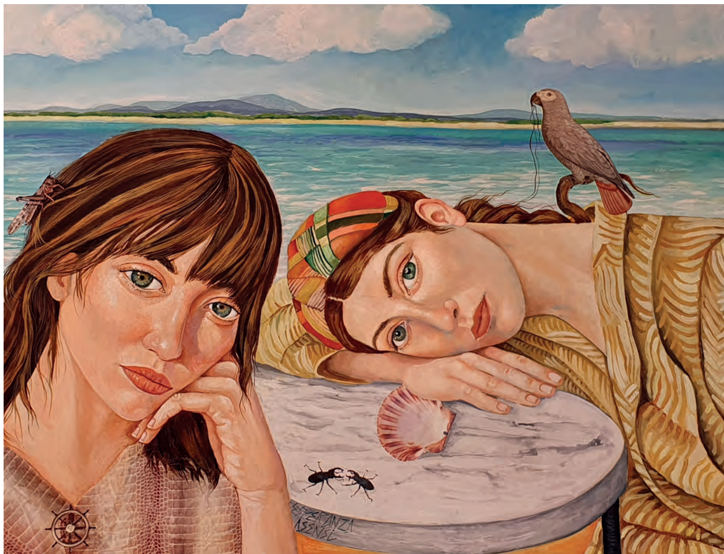
El loro / Óleo sobre lienzo. 100x81