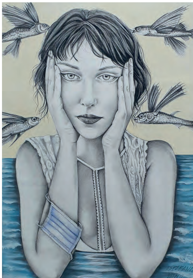
Nereida / Mixta sobre papel 100x70