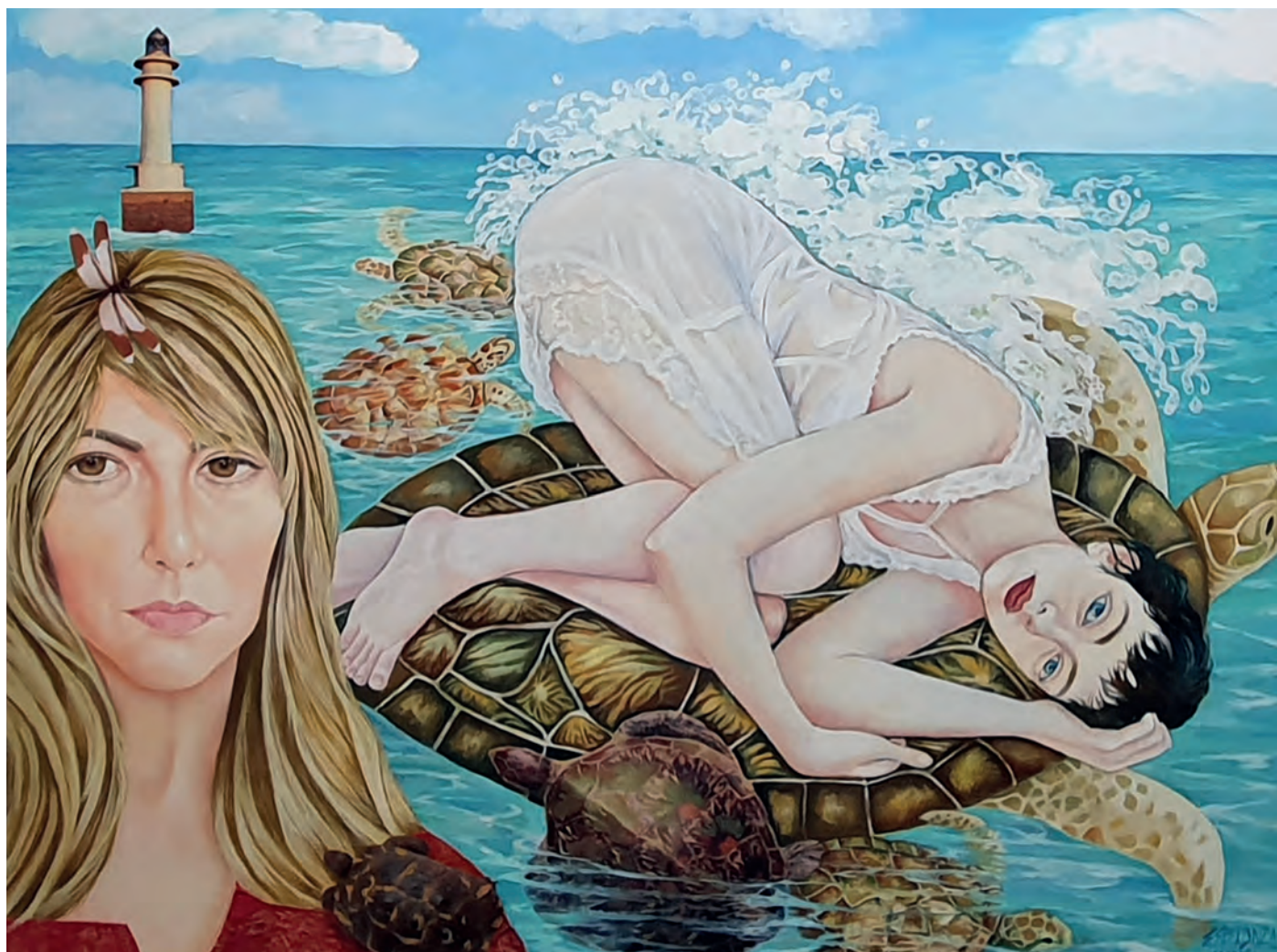
Las tortugas marinas / Óleo sobre lienzo 116x89