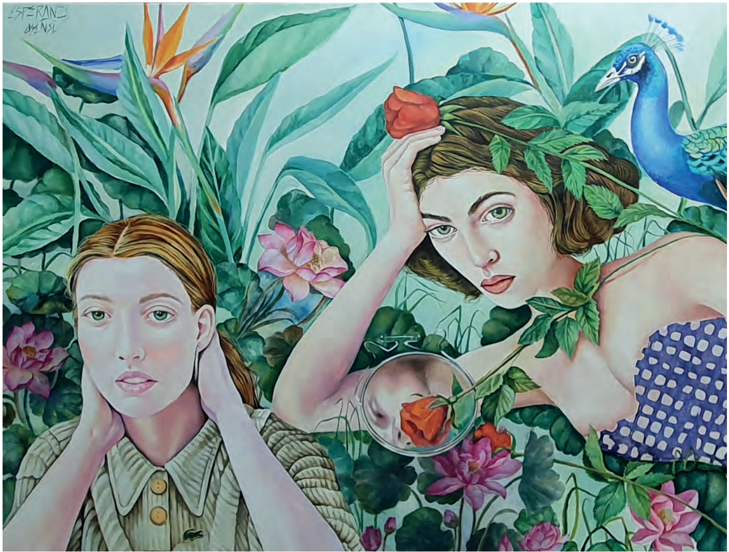
El Pavo Real / Óleo sobre lienzo. 116x89