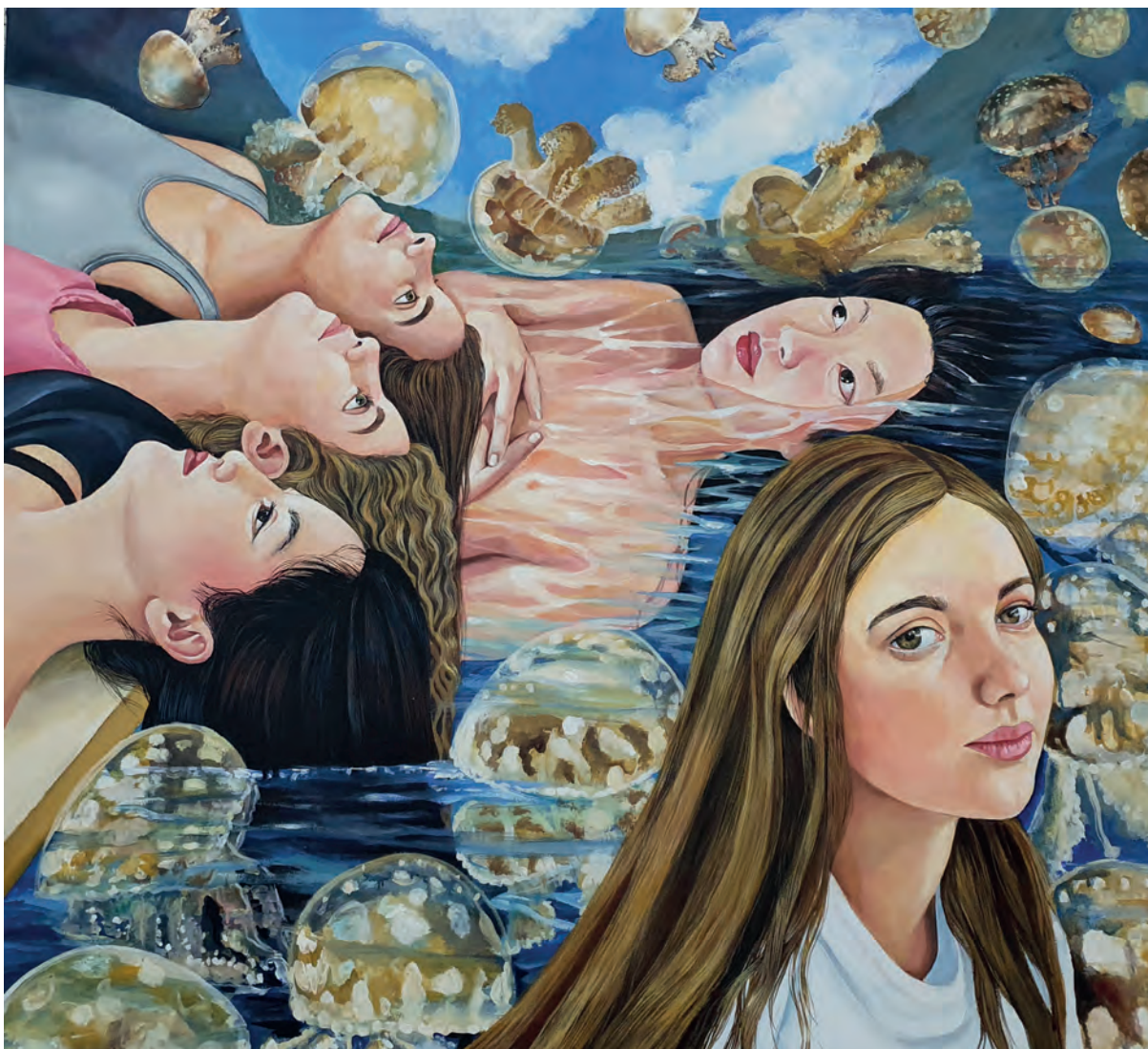
Las medusas / Óleo sobre lienzo. 100x90