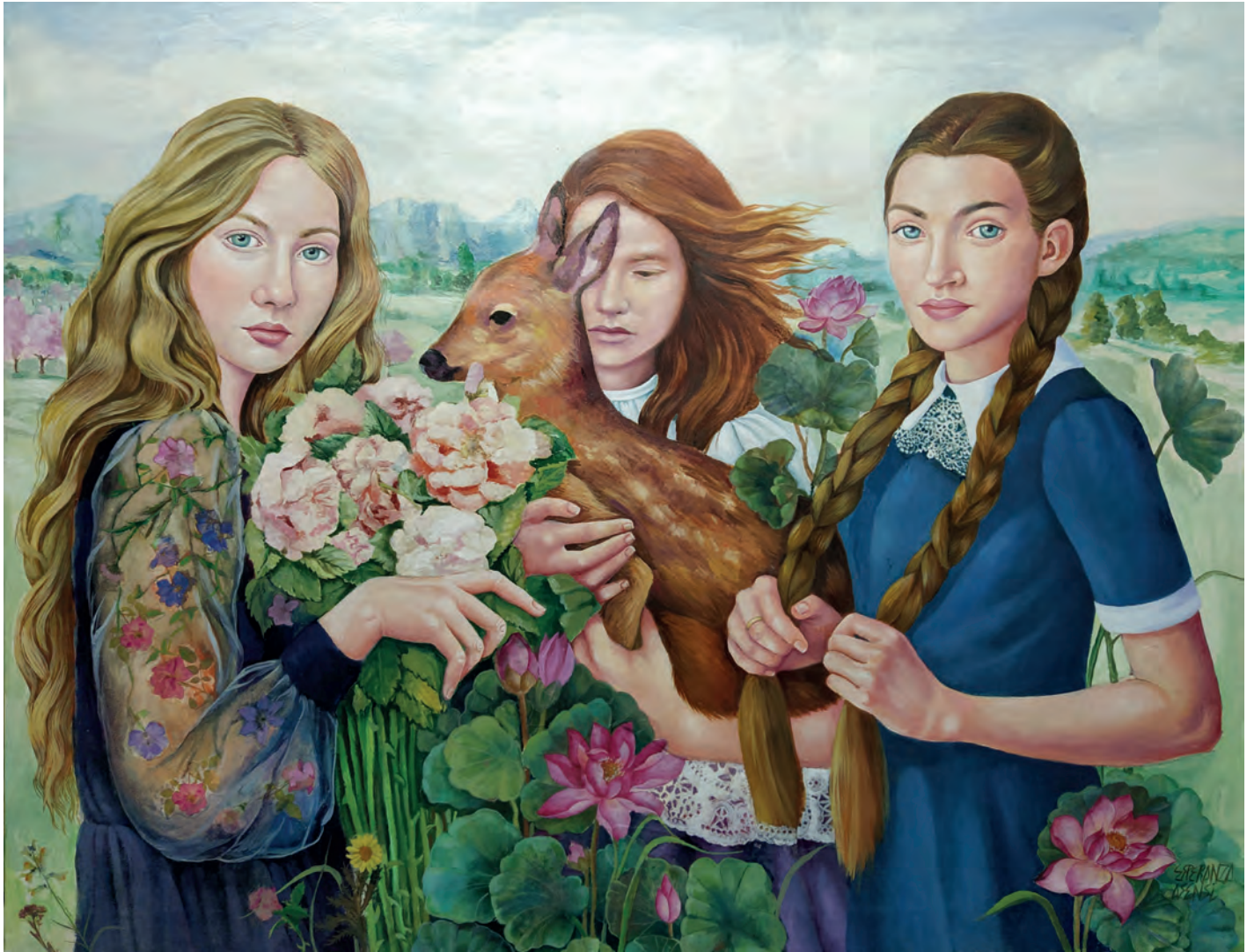
El ciervo / Óleo sobre lienzo. 116x89