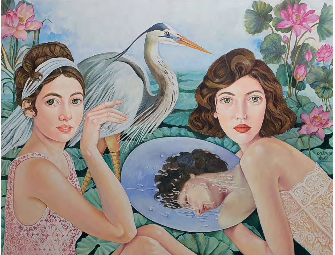
La Garza / Óleo sobre lienzo 116x89