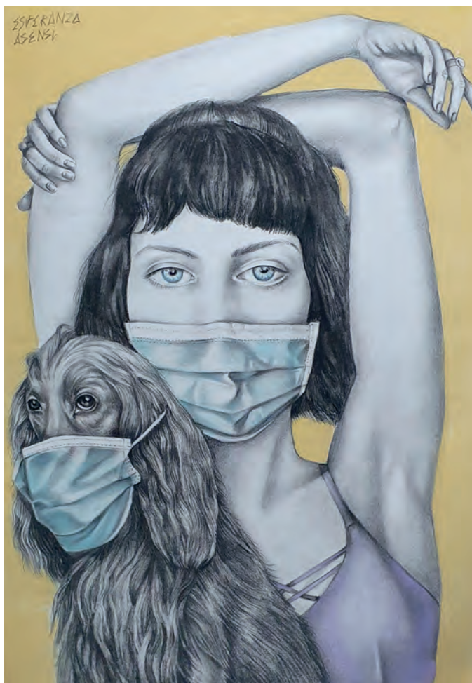
Lélape / Mixta sobre papel 100x70